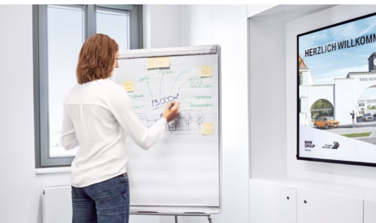
Kombinieren Sie den architektonischen Reiz mit den Vorzügen moderner Ausstattung.