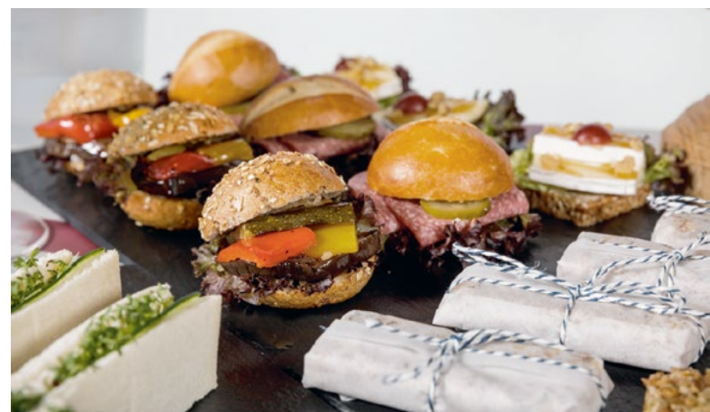
Genießen Sie eine kulinarische Pause von bester Qualität.