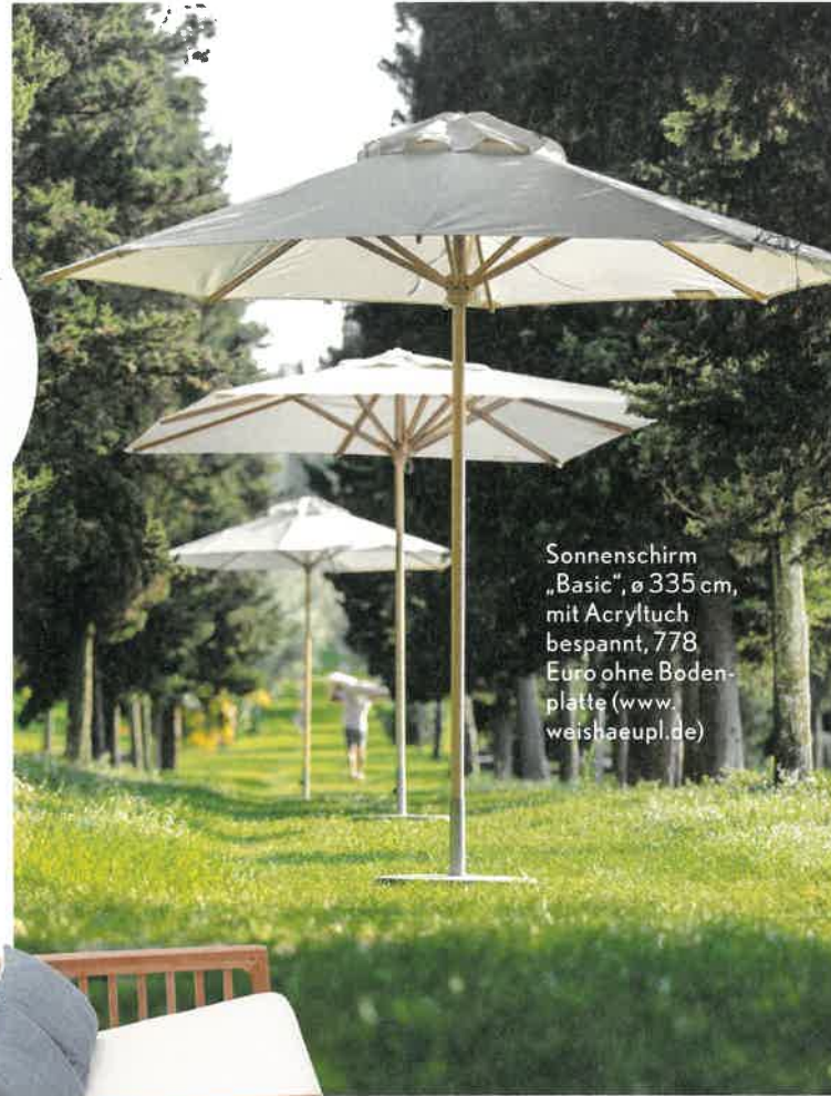
Sonnenschirm „Basic“, ø 335 cm, mit Acryltuch bespannt, 778 Euro ohne Boden- platte ( www. weishaeupl.de )