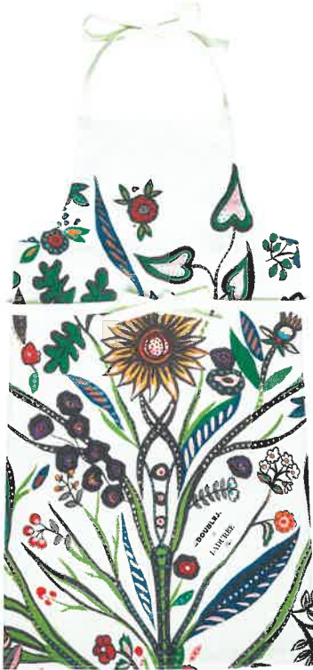
Steht auch im Garten gut: Schürze „Tree of Life“ entstand in Kooperation mit der Pariser Patisserie Ladurée, 80 Euro ( www.ladoublej.com )