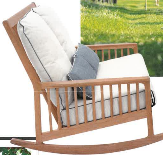
Schaukelbank „Newhaven“ aus Teakholz, inklusive Polster und Versand 2750 Euro ( www.garpa.de )