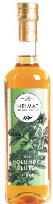
Mix it! Feiner Holunderblütensirup mit einem Schuss Zitronensaft, 10 Euro ( www.feinkost- kaefer.de )