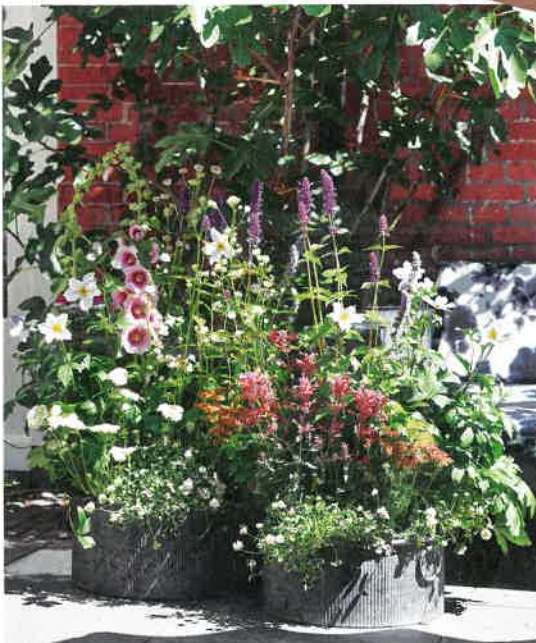
Be(e) friends: Wer beim Begrünen abwechslungsreich heimische Pflanzen wählt, unterstützt damit die Bienenpopulation.

Mehr Tipps und Inspirationen: www.pflanzenfreunde.de